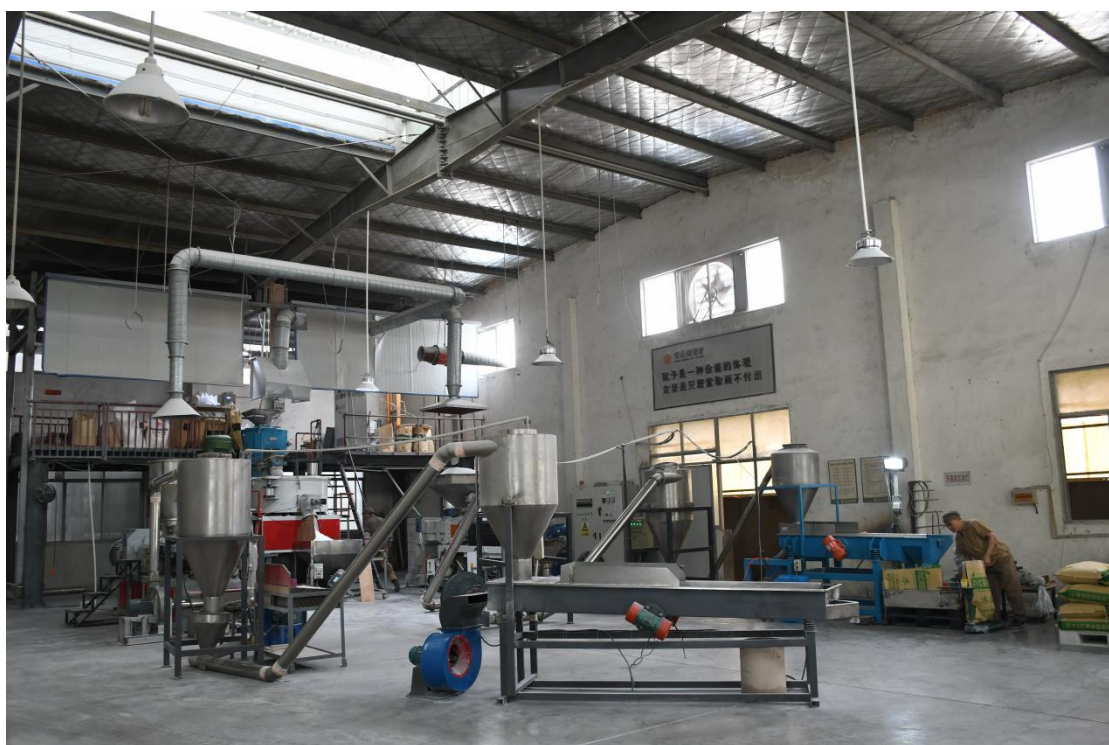
图 1 先进的造粒设备