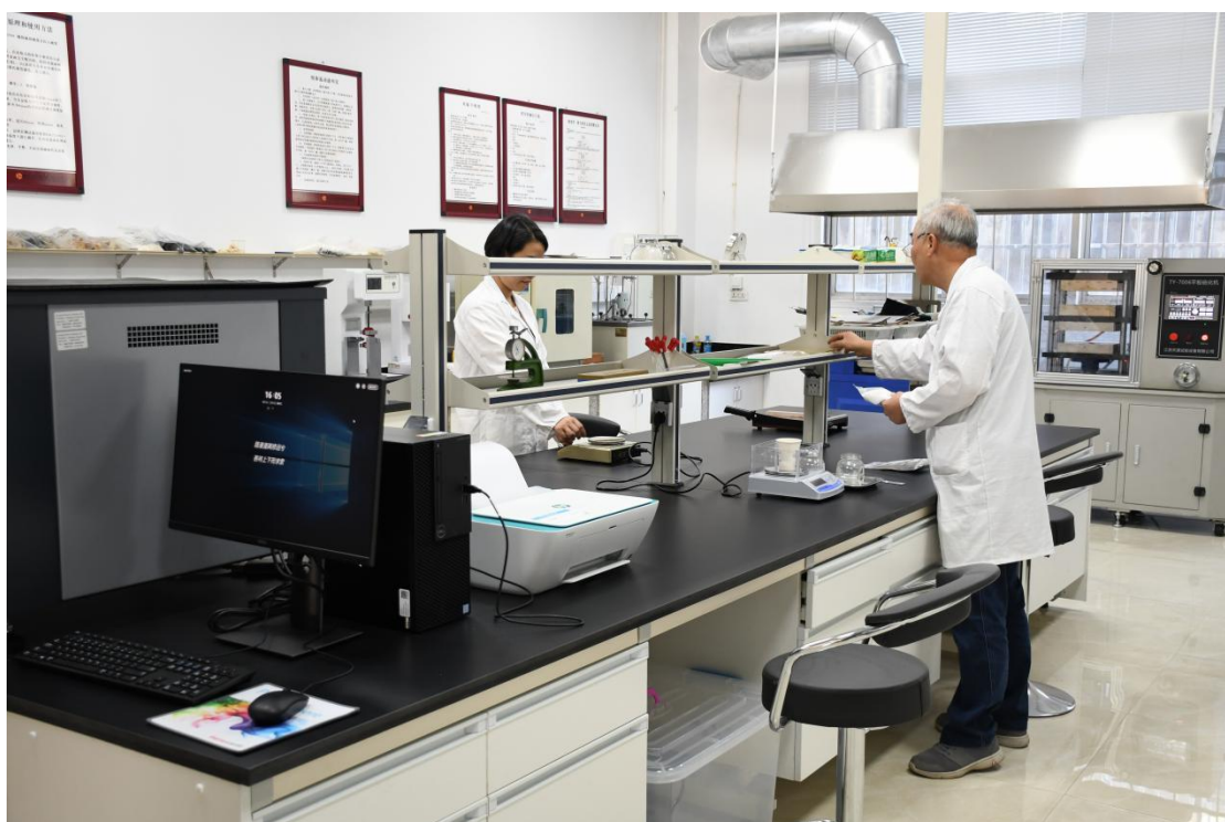
图 2 先进的实验室