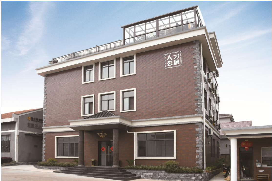
图 3 拎包入住的人才公寓

公司参照 ISO 14001 标准的要求，对工作场所的环境因素进行识别，并采取相应的防护措施。公司每年还举行多种活动，让员工参与安全环境改善工作。